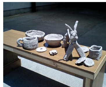
〈会心の作 粘土細工〉

コップ、お皿、亀、馬っぽい生き物？ 投げ銭?? みんなユニークな作品を作っています。下の写真は染物。なんと今回の染料は玉ねぎの煮汁です。デイルームは一時、オニオンスープの香りに包まれましたが、お見事、和テイストな感じに染め上がりました。今回は利用者さんのご愛用のハンカチをお借りして撮影しました。