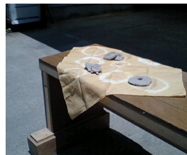
〈雅の逸品 手拭い染め〉